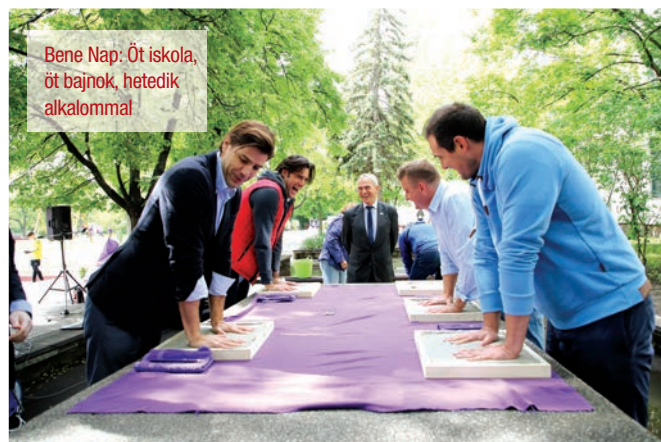
Bene Nap: Öt iskola, öt bajnok, hetedik alkalommal

A szokásokhoz híven ezúttal is olimpiai és világbajnokok hagyták kézlényomatukat az iskolában, ami után a gyerekek egy autogramosztás keretén belül faggathatták őket sporteredményeikről, a mára legendássá vált olimpiákról és más világvversenyekről. Kovács Péter kézilabdázó, valamint Varga Tamás, Madaras Norbert, Székely Bulcsú és Hosnyánszky Norbert olimpiai bajnok vízilabdázók kézlényomatai az iskola büszkeségfalán kapnak helyet. HK