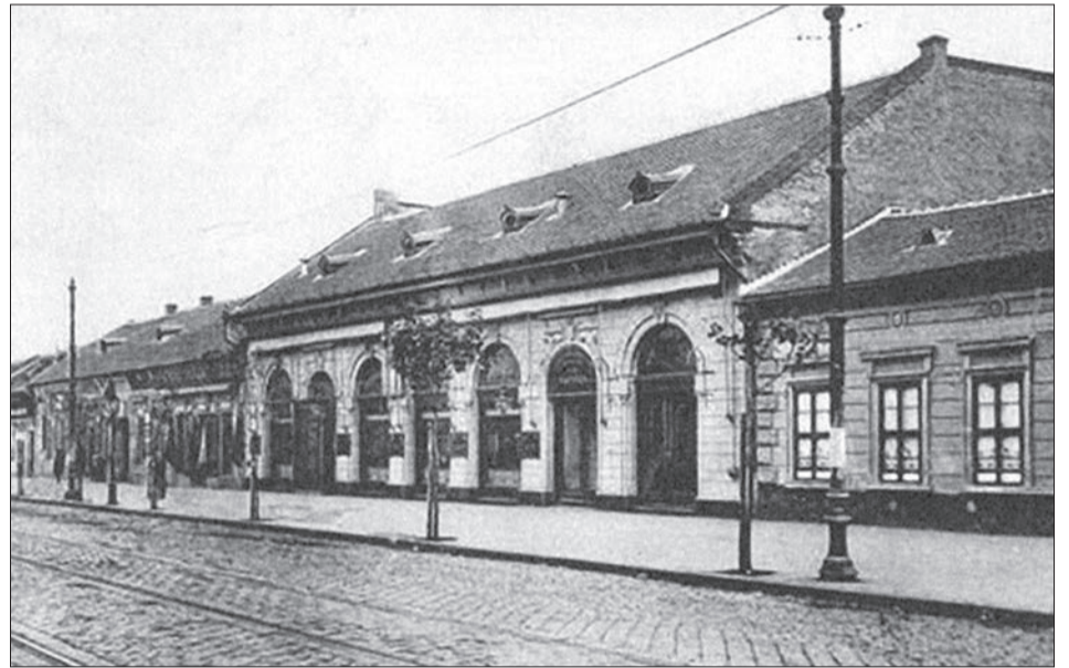
Az Újpesti Közművelődési Kör 1898-ban épült székháza

Szűkebb pátriánk első közösségi művelődést szolgáló létesítménye a mai Árpád út 66.-ban lévő Polgár Centrum épülete. Településünk alapításának 180. évében érdemes megismernünk egyik ikonikus épületünk történetét. Létrejött, Újpestre jellemző módon, civil kezdeményezésnek köszönhető.