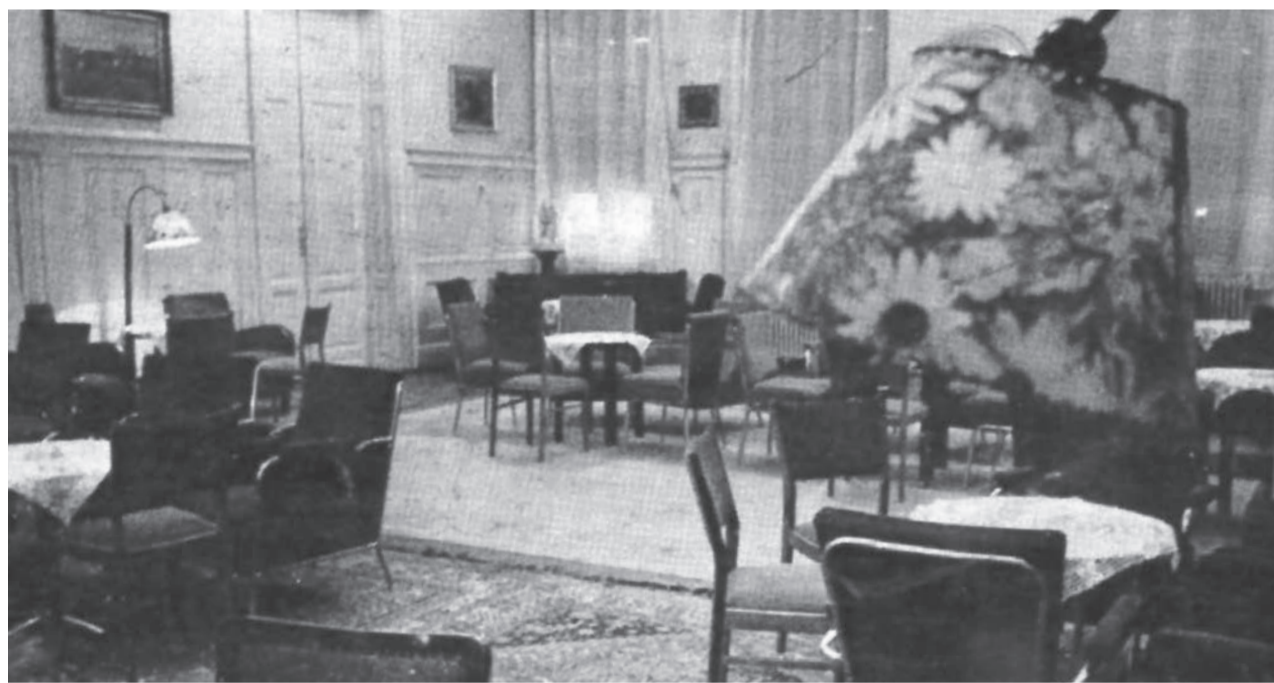
A székház klubhelyisége az 1970-es években. Az intézmény ekkoriban az Ady Endre Művelődési Ház nevet viselte.

lekből ösztöndíjalapot hoztak létre, amelyből tehetséges, szegény gyerekeket támogattak. Közel ezerkötetes gyűjteményük közkönyvtárként működött. Dr. Ugró Gyula, az egyesület egyik alapítója, majd elnöke a szervezet 50. születésnapján így