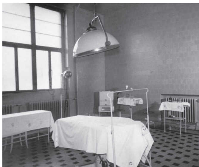
A Sándor Pavilon

A műtőt és a laboratóriumokat az akkoriban legmodernebb műszerekkel szerelték fel.