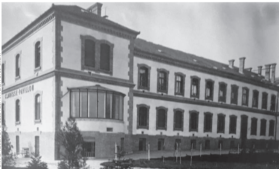
A Clarisse Pavilon