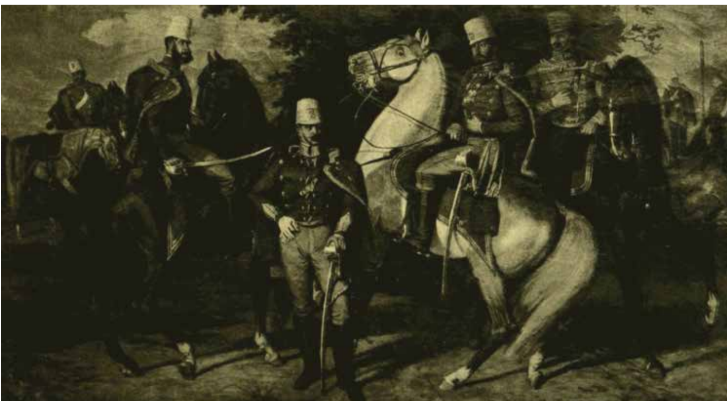
A Károlyi-huszárezred tisztjei. – Lotz Károly festménye a főtí kastélyban

környékbeli birtokai (beleértve Újpest község) fejlesztésével foglalkozott. A lábát megtámadó betegség, mely olykor nagyon megnehezítette számára a járást, szintén gátolta benne, hogy személyesen vegyen részt a pesti politikában.